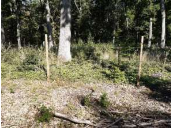
Eichennaturverjüngung innerhalb und außerhalb eines Zaunes

Wald und Natur Der Trend der trocken-heißen Sommerhalbjahre setzt sich leider fort, auch 2022 war in der Vegetationszeit rekordverdächtig niederschlagsarm und sehr warm. Für viele Bäume und vor allem auf ohnehin schwierigen Standorten (reine Sand- oder Tonböden, flachgründige Kuppenlagen etc.) geht es ums Überleben. Zum Glück gab es in diesem Jahr bislang keine markanten Sturmereignisse; und der Fichten-Borkenkäfer „Buchdrucker“ machte sich erst erstaunlich spät bemerkbar, dann aber heftig. Reine Fichtenbestände, im Landkreis ohnehin selten, werden mittelfristig wohl vollständig verschwinden, auch Lärchen und Kiefern haben Probleme, bei den Laubbäumen vor allem die Buche, unsere häufigste Baumart (siehe unten). Bei den Neupflanzungen auf Kalamitätsflächen gab es sehr hohe Ausfälle, bis zu 90 %, viele frisch gesetzte Pflanzen vertrockneten. Auch müssen fast alle Bäumchen gegen Rehwild-Verbiss und „Fegen“ (Rehbock) technisch ge-