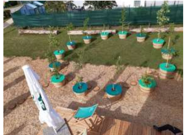
Baumarten für morgen auf der Gartenschau Eppingen

Bei der Gartenschau in Eppingen haben wir die Folgen des Klimawandels für den Wald in den Fokus gestellt und u.a. zukunftsfähige Baumarten vorgestellt, ebenso die Forstwirtschaft im Landkreis Heilbronn, mit Fotos und Texten von Mitarbeiterinnen und Mitarbeitern. Bei der Standbetreuung gab es viel Unterstützung von Forstkollegen aus Nachbarlandkreisen.