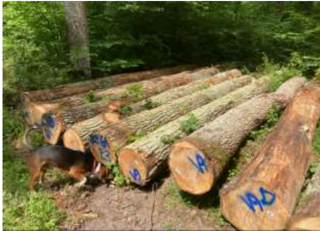
schwaches Eichenstammholz aus Durchforstungen für Kanthölzer und Parkett

entsprechend gehandelt wird. Die Sägewerksbranche leidet jedoch auch unter den enorm gestiegenen Energiepreisen, im speziellen, den Strompreisen. Produktion und vor allem Trocknung der Schnitthölzer sind sehr Strom intensiv. Insgesamt ist die Situation daher im Buchen-Schnittholzmarkt von viel Unsicherheit geprägt. Das bedeutet für den Buchen-Stammholzverkauf genau auf Marktstörungen zu achten und entsprechend zu reagieren. Eiche und Esche sind nach wie vor und auch mit Preissteigerungen von ca. 20 % am Markt stark nachgefragt.