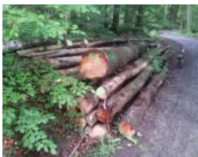
"Brennholz lang" oder "Polterholz"

Holzmarkt Wer aktuell den Holzmarkt verfolgt, stößt unweigerlich fast nur auf die extrem hohe Nachfrage nach Brennholz . Dies ist zunächst saisonüblich, aber in der Form noch nicht da gewesen. Die Nachfrage übersteigt bei weitem die Bereitstellungsmenge, und daher empfehlen wir den Waldbesitzern, die Mengen zu kontingentieren, um möglichst viele Anfragen bedienen zu können. Die deutliche Preissteigerung auf nun ca. 91 € pro Festmeter (brutto) ergibt sich zum einen aus der Nachfragesituation, zum anderen aber auch aus der Konkurrenzsituation zu anderen Sortimenten. Die stoffliche Verwertung z.B. als Buchen-Industrieholz (für Zellstoff, Hygienepapiere etc.) steht preislich dem Brennholz in nichts nach.