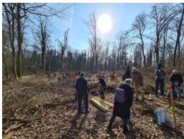
Reges Treiben bei der Pflanzaktion in Erlenbach

Baumpflanzkampagne „Unser Wald von morgen“ Erfreulich groß ist weiterhin das Interesse der Bürgerinnen und Bürger am heimischen Wald sowie der Tatendrang, sich für diesen einzusetzen und ihm Gutes zu tun. Mit der vom Kreisforstamt im Herbst 2021 gestarteten Aktion „Unser Wald von morgen“ wird den Waldfreunden im Kreis die Möglichkeit gegeben, sich finanziell durch Baumspenden oder tatkräftig durch die Teilnahme an Baumpflanzaktionen am Stärken des heimischen Waldes für den Klimawandel zu beteiligen. Nachdem vor allem im vergangenen Frühjahr eine Vielzahl an Pflanzaktionen mit zuvor gespendeten Bäumen stattgefunden hat, geht es zum Jahresende mit Aktionen z.B. in Neuenstadt und Bad Friedrichshall weiter. Für das Frühjahr sind bereits Bürgerpflanzaktionen im Zabergäu und in Eppingen geplant.